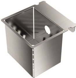
Cuvette perforée en acier inoxydable 8151 001