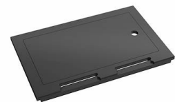
Kit Black 8100 037