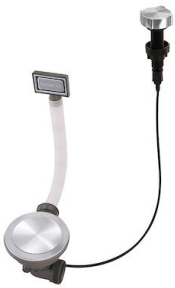
Vidange automatique Space Milano 8407 115