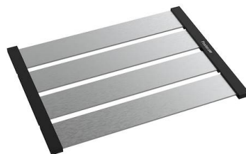
Foldable rack 8110 000