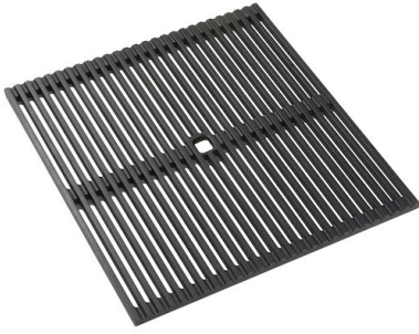
Grille Black 8100 600