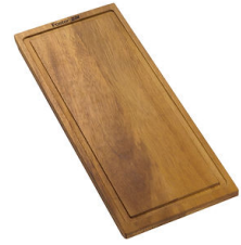
Planche de découpe en noyer 8642 000