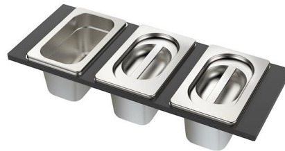
Ensemble de 3 bols 8100 622