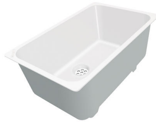
Cuvette blanche 8153 100