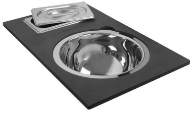
Kit multi-bol 8100 628