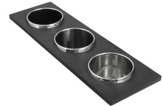
Ensemble de 3 porte-bouteilles 8100 621