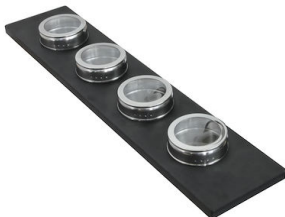
Ensemble de 4 porte-épices 8100 620